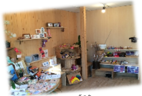
プチ雑貨ショップ