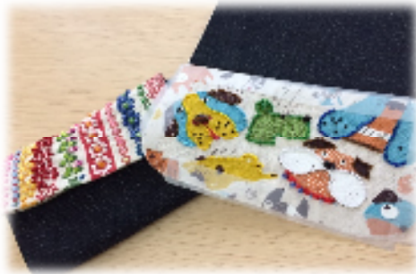
手書き柄の布製品も製作開始!